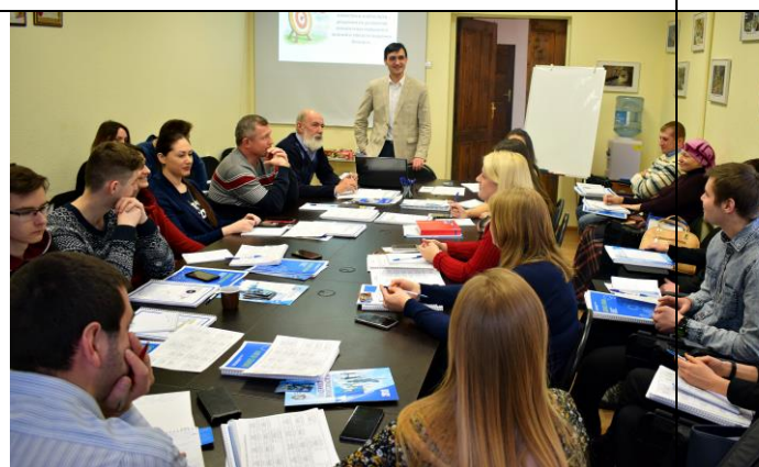
Обучение по программе Корпорации МСП «Азбука предпринимателя»