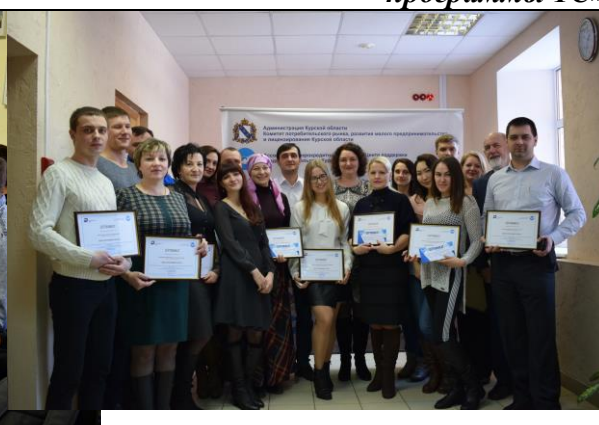
Обучение по программе Корпорации МСП «Школа предпринимательства»