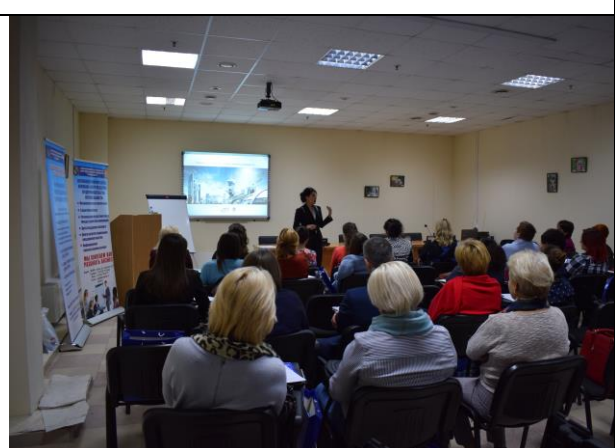
Группа слушательниц тренинга «Как формировать свое будущее в бизнес-среде индивидуально и творчески»