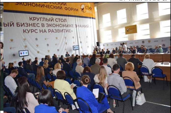
VII Среднерусский экономический форум 8 июня 2018 г.