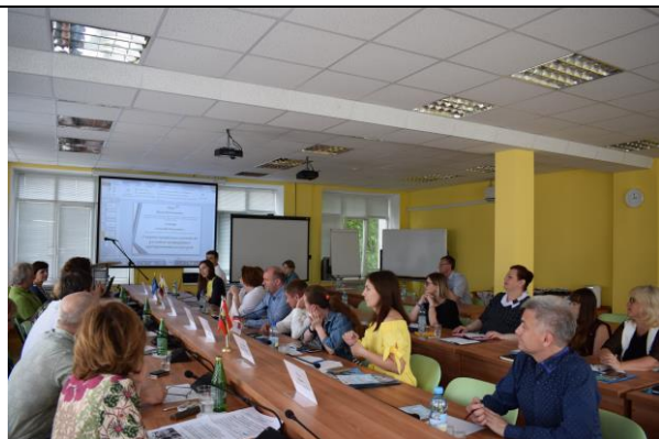
Круглый стол «Наставничество как элемент развития бизнеса» 17 мая 2018 г.