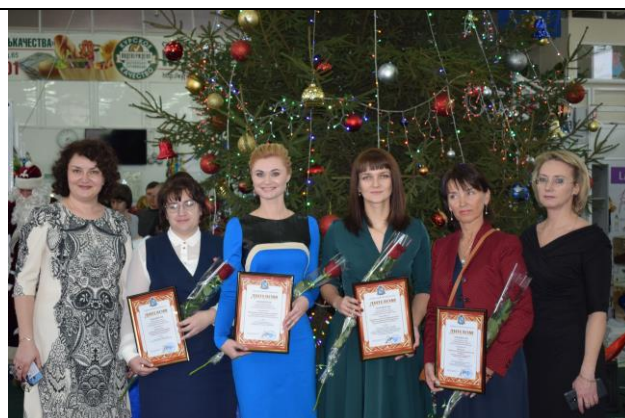
Награждение победителей регионального этапа IV Всероссийского конкурса «Лучший социальный проект года» 25 декабря 2018 г.