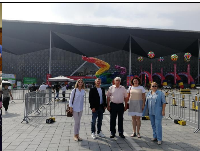
Бизнес-миссия в Китай, октябрь 2018 г.