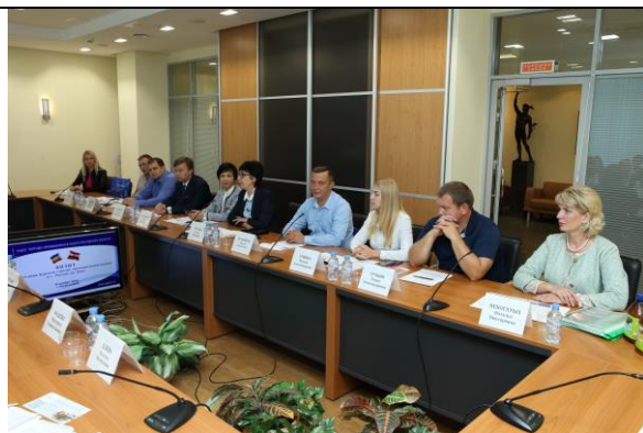
Бизнес-миссия в Ростовскую область, сентябрь 2018 г.