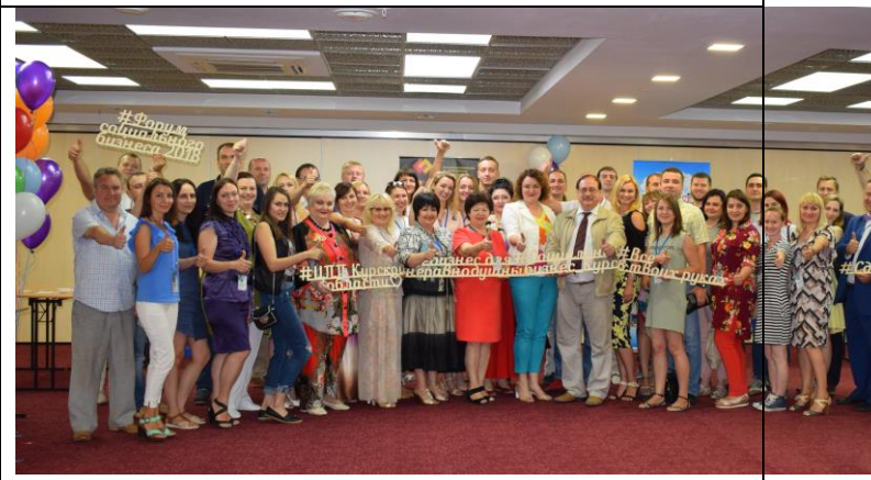
Форум социального бизнеса 28 июня 2018 г.