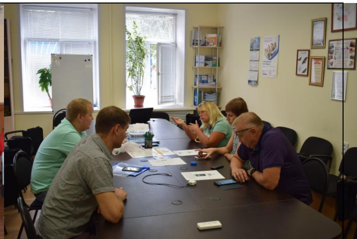
Центр инжиниринга проводит рабочую встречу по вопросу разработки проекта «Умная одежда»