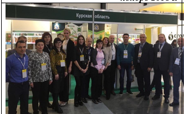
Предприниматели региона на XXVII Международной продовольственной выставке «Петерфуд», 13-15 ноября 2018 г.