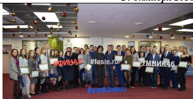
Финальный отбор по программе «УМНИК» 22 ноября 2018 г.