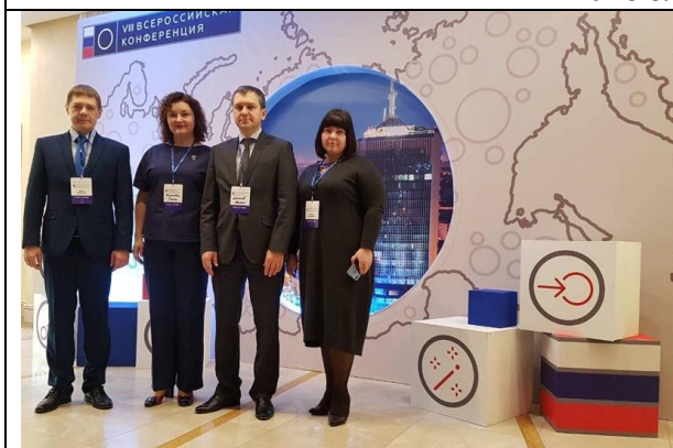
VIII Всероссийская конференция «Развитие системы инфраструктуры поддержки субъектов малого и среднего предпринимательства» в Челябинске, 10-12 декабря 2018 г.