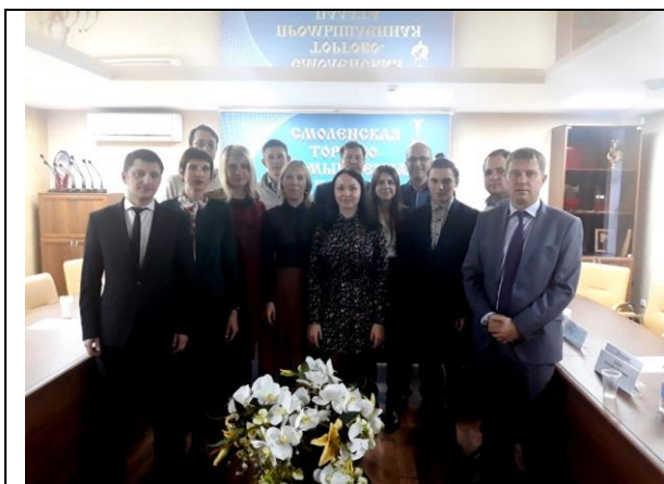
Бизнес-миссия в Смоленскую область, ноябрь 2018 г.