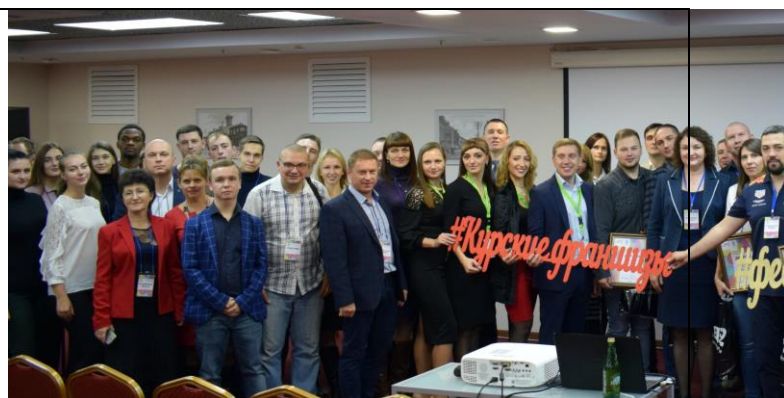
Фестиваль франшиз 24 октября 2018 г.