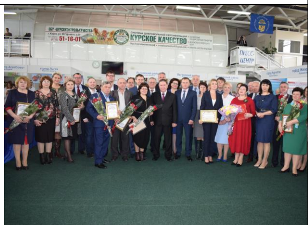
Региональный форум малого и среднего предпринимательства «День предпринимателя Курской области» 27 апреля 2018 г.