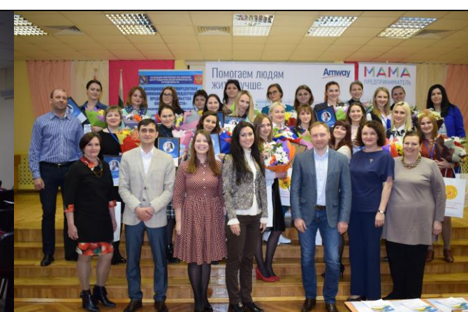
Обучение по программе Корпорации МСП «Мама-предприниматель»