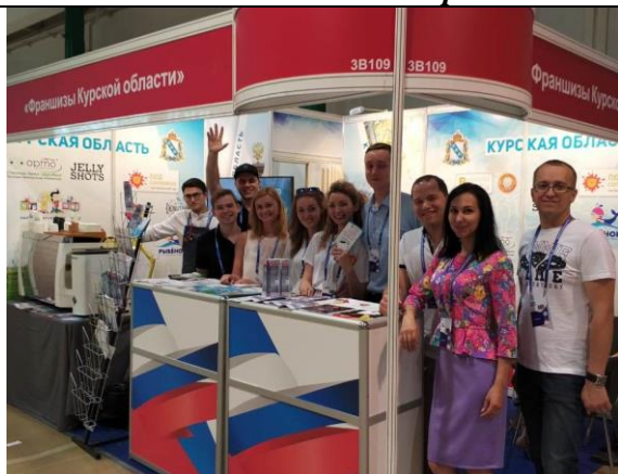
Курские предприниматели на международной выставке франшиз BUYBRAND EXPO 2018 в Москве