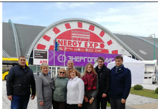
Бизнес-миссия в Белоруссию, октябрь 2018 г.