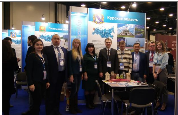
XII Петербургский Партнериат малого и среднего бизнеса