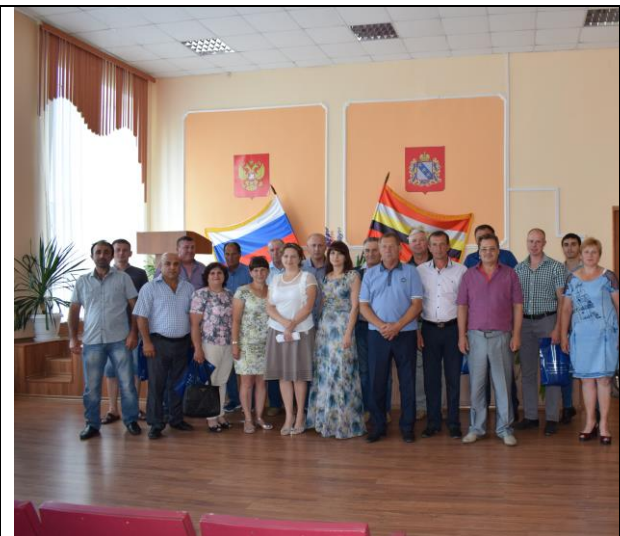
«Академия фермера», семинар 20.06.2018 г., п. Пристенъ