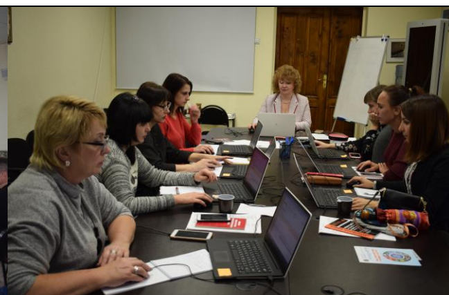
Семинар «Бухгалтерский учет и налогообложение с использованием программы 1С»