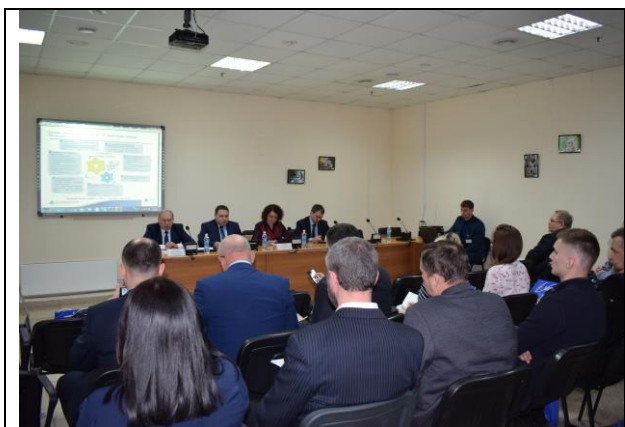
Семинар «Участие субъектов МСП в госзакупках»